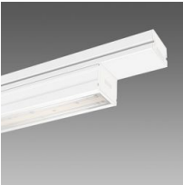
6602 Techno System - bi-asimétrico 25° - CRI 90