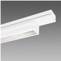
6601 Techno System - asimétrico 25° - CRI 90