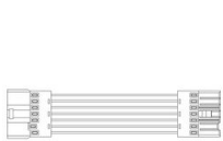
6621 Junta electrificada