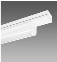
6605 Techno System - difusor semiesférico extensivo - CRI 90