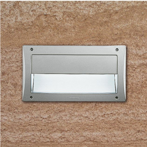
1607 Box 1 LED - schermo a palpebra asimmetrico